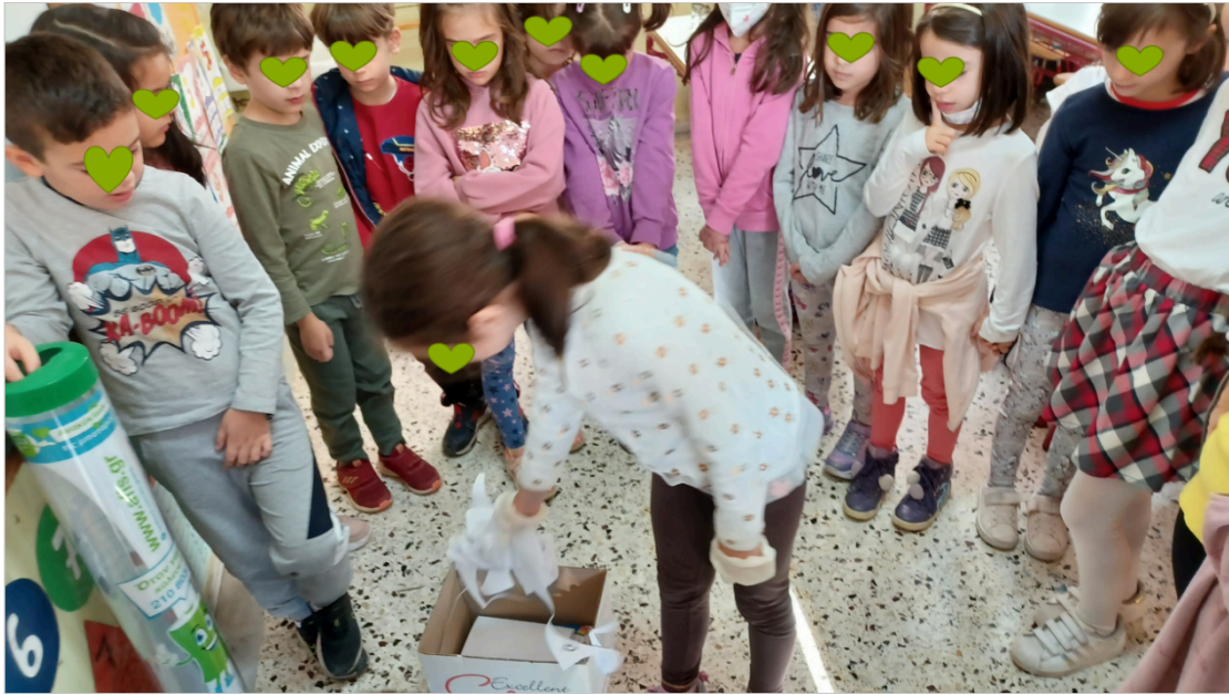
Α' Δημοτικού: Μαθαίνουμε να ανακυκλώνουμε σωστά