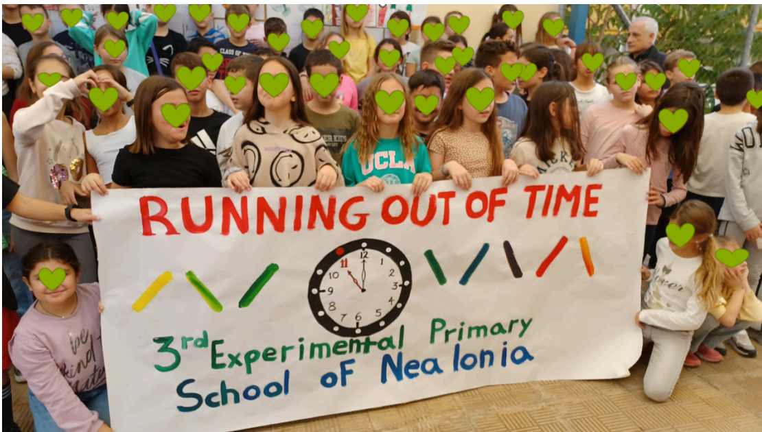
Les plus jeunes, de 6 ans, ont abordé le thème du réchauffement climatique par des dessins.