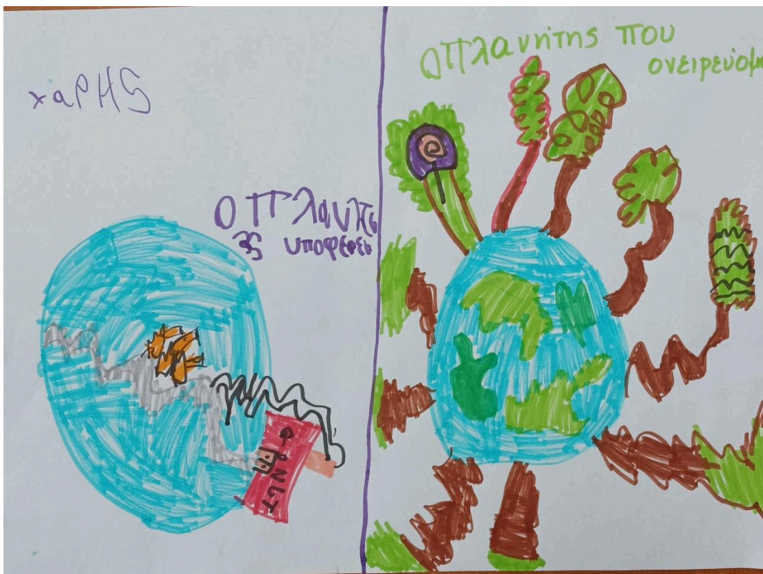
Ils ont appris à faire du recyclage.