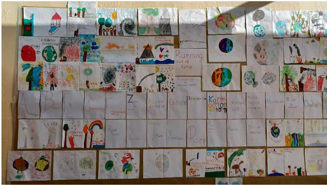
Tous les élèves de l'école ont participé à la course de relais RUNNING OUT OF TIME pour le changement climatique.